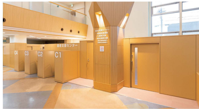
入り口右手側にご 있습니다。ご利用の場合は受付までお越し下さい。

患者支援センターでは入院前の説明や指導、退院・転院の調整、さらに医療や福祉の相談・在宅支援サービスに関する相談・医療費に関する相談など、患者さんの医療に関する様々な相談を受け付けています。なにかお困り事がございましたら患者支援センターへ起こし下さい。