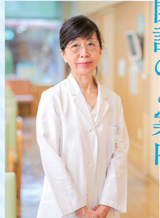
副院長 | 患者支援センター統括