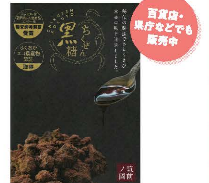
ちくぜん黒糖、黒蜜 （ちくぜん野の花：野の花学園）

障がい福祉サービス事業所ちくぜん野の花 （社会福祉法人 野の花学園） 〒838-0214 朝倉郡筑前町東小田3539-10