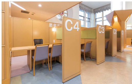
相談窓口が3ブース（C1～C3） 紹介窓口が1ブース（C4）ご 있습니다。