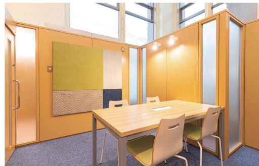
個室でのご相談も行っております。

患者支援センター設立に伴い、受付・会計の窓口、再来受付機、自動精算機の配置が変更になっておりますのでご注意ください。