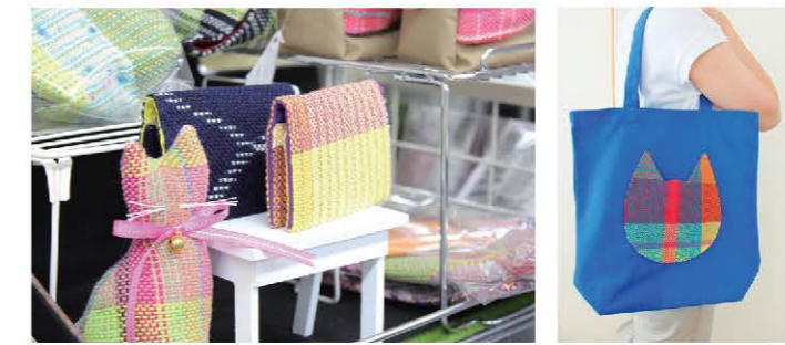
さおり織り、手作り布製品（あけぼの園：福岡コロニー）

「なでしこSHOP」は、地域の障がい者事業所の紹介と、施設で作られる製品の展示、販売を目的に当院2階ヤマザキショップ内に設置しました。商品には手作り布製品（猫の刺繍入りトートバックやポーチ等）や具のコンクールで審査員特別賞を受賞した黒砂糖・黒蜜（サトウキビの収穫、加工等一貫生産）等があります。製品の販売代金はすべて、製品を作成した障がい者事業所の活動資金に充てられます。院長をはじめ、事務部長の「SDGsを念頭に積極的な地域活動を！」との号令をもとに医療ソーシャルワーカーが協力施設に直接足を運び交渉、調整を行い、令和3年7月21日、開店初日を迎えることができました。