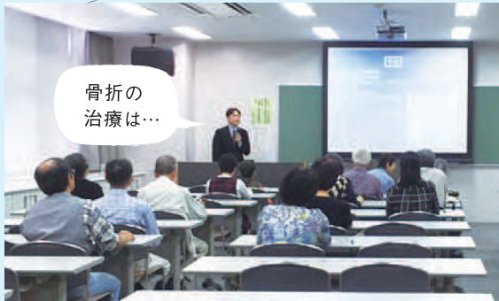
健康講座のようす

2015年10月に行われた「骨折の検査と治療～整形外科医の考え方～」の講座のようすです。