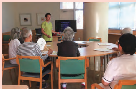
心臓病教室の様子