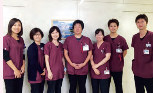
検査部 臨床検査チーム

体表エコー 胸や首にしこりのある方はご相談ください。癌や腫瘍、乳腺炎の発見につながります。また、体感温度の上昇や、過剰な発汗のある方のご相談もお待ちしております。