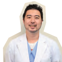
お話を聞いた先生

ることが知られており、治療できるものもあります。また、脳梗塞など他の重篤な病気が発見されることもあるので、まずは気軽に相談にきてください。