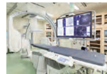
バイプレーンシステム

MRIなどの検査で脳に血管の狭窄や動脈瘤が見つかった場合は、さらに検査機器で脳の血管内を詳しく調べます。最新鋭のバイプレーンシステム血管撮影装置を使った検査では、血管の流れをより精密な3D画像で見ることができるので、患者さんの病状を詳細に把握し、最適な治療を行うことができます。