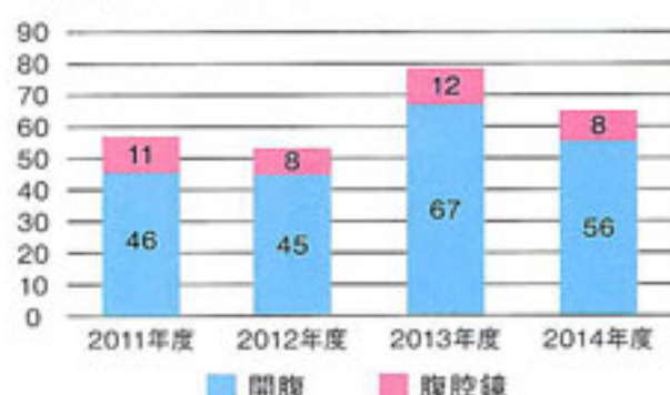
年度・開腹・腹腔鏡別の大腸がん手術件数