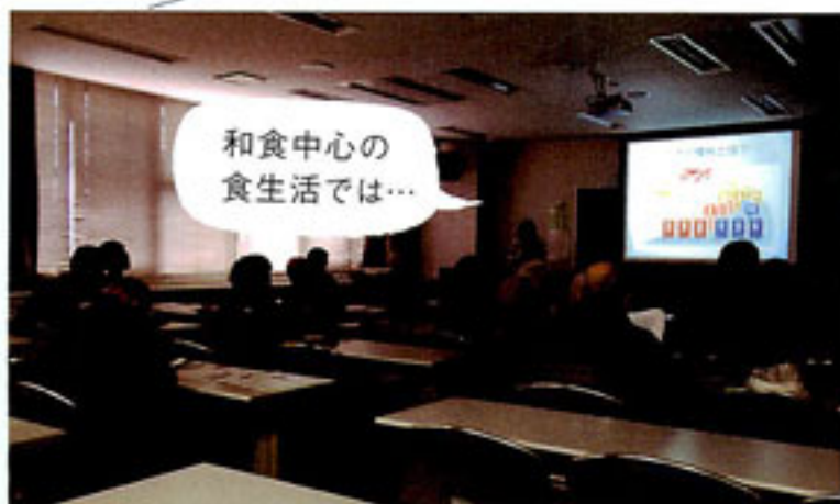
健康講座のようす 2015年3月に行われた「和食で健康ライフ」の講座のようすです。

当院では筑紫野市の中核病院としてその役割を果たすべく日頃より高度医療の推進及び地域医療への貢献を目標に精進しております。その一環といたしまして、地域の皆様方へ対し健康に関する公開講座を開催しております。 公開講座は太宰府市地域健康部元気づくり課と筑紫野市健康推進課と連携して病気に対する知識と予防・健康に関する情報をわかりやすいテーマで講演したいと思っております。